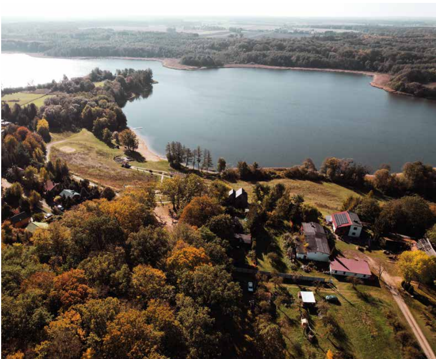
Jezioro Wfókna, fot. Kasper Grzegorzewski