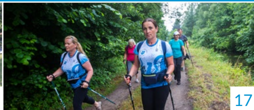
NOCNY NORDIC WALKING

Nr 8 (Rok XXI) • Sierpień 2019 • Miesięcznik