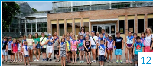
LATO Z NAUCZYCIELAMI