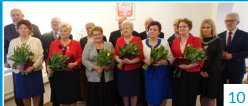
50 LAT NA DOBRE I NA ZŁE