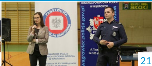
NARKOTYKI I DOPALACZE ZABIJAJĄ