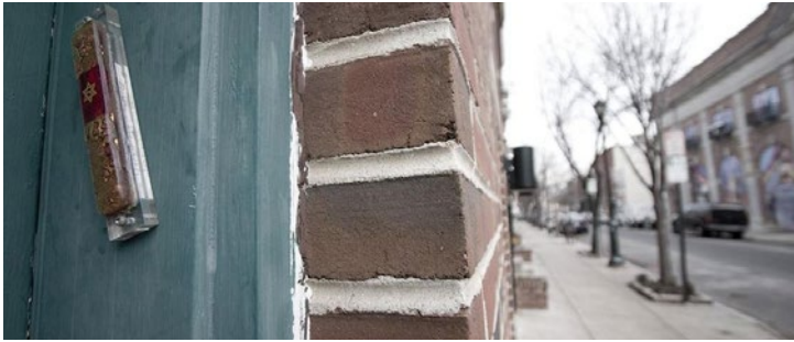
Mezuzah na drzwiach jednego ze współczesnych żydowskich domów.

Realizując projekt „Chawerim Towim - Poznajemy się”, wdrażający do dialogu międzykulturowego, opartego o tolerancję wobec religii, kultury i tradycji żydowskiej, zapoznaliśmy uczniów z ważnymi przedmiotami znajdującymi się w żydowskich domostwach.