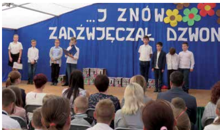
Rozpoczęcie roku w Jabłkowie

W poniedziałek 3 września Mazurkiem Dąbrowskiego zainaugurowano uroczyste rozpoczęcie nowego roku szkolnego dla 199 uczniów Szkoły Podstawowej w Jabłkowie.