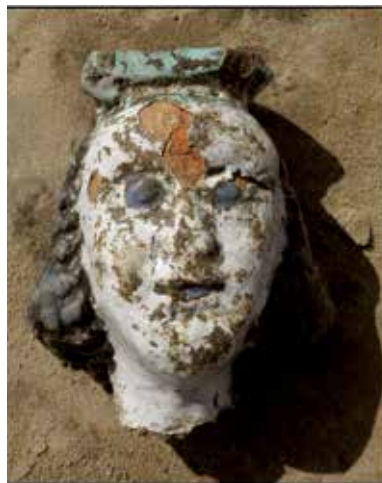
Kafel w kształcie głowy kobiety

Za największy sukces tego sezonu uznajemy odkrycie (w zachodniej części wykopu) fragmentu budynku dworskiego, który to, jak oszacowaliśmy na podstawie zdjęć lotniczych, miał wymiary około 11 x 9 m. Mimo, że w tym roku odstoniliśmy niecałe 10% zarysu dworu, to na szczególną uwagę zasługuje duża kolekcja kafli piecowych. Większość z nich jest bogato zdobiona motywami roślinnymi (chabry, kwiaty lotosu, winorośl), przedstawieniami cherubinków i fantastycznych zwierząt i dodatkowo pokryta barwnymi polewami. Zabytki te związane są z najmlodsza fazą istnienia rezydencji szlacheckiej, która przypadła na 2 połowę XVII wieku, a być może też początku kolejnego stulecia. Szczególną uwagę zwraca pięknie wykonany kafel w kształcie głowy kobiety, który z przymrużeniem oka nazwaliśmy „Dzwonowską Nefertiri”. W pobliżu pozostałości dworu Rogalińskich odstoniliśmy też kilka zagadkowych jam wypełnionych kamieniami, gruzem ceglany, polepą i gliną. Prawdopodobnie w miejscach tych osadzone były drewniane pale tworzące konstrukcję nośną XIV-XV - wiecznej wieży mieszkalno-obronnej. Z tą fazą funkcjonowania siedziby pańskiej związane są liczne zabytki: ostroga żelazna, fragmenty importowanych naczyń kamionkowych i nadzwyczaj liczne w tym roku denary jagiellońskie. Odkryciom średniowiecznym i nowożytnym towarzyszyły też znaleziska o wiele starsze - narzędzia krzemienne i fragmenty naczyń pochodzące z neolitu (ok. 5 000 lat temu). Zabytki pozyskane w trak-