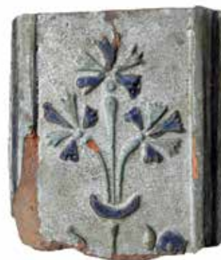
Kafel z XVII wieku z ornamentem kwiatowym

cie badań dzwonowskich już niedługo będzie można podziwiać na wystawie w Muzeum Regionalnym w Wągrowcu. Wybrane artefakty będą również eksponowane w Muzeum Historii Polski, które powstaje obecnie na warszawskiej Cytadeli.