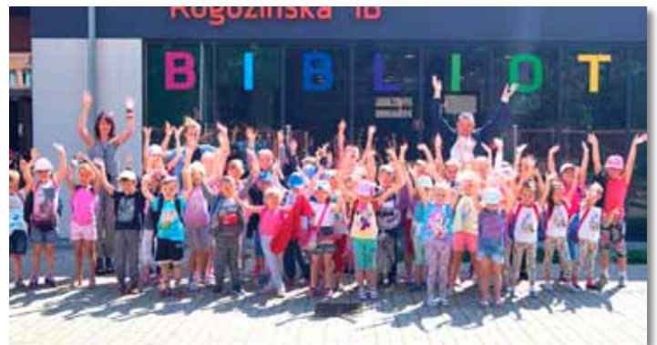
Zdjęcia z Lata z Biblioteką znajdują się na stronie www.gmina-skoki.pl oraz na rozkładówce gazety.

Tworzyliśmy: ukraińską sztukę ludową, decupage, papieroplastykę, metaloplastykę, teatr, lalki, lepiłiśmy z gliny, tańczyliśmy zumbę. Były animacje dla dzieci i filmy z popcornem.