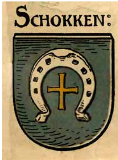
Herb Skoków według ilustracji z XIX wieku.

Miasta prywatne, a do takich należały Skoki, przyjmowały zazwyczaj godło odpowiadające znakowi herbowemu ich właścicieli. Biorąc pod uwagę, że założyciel Skoków oraz jego spadkobiercy byli herbu Nowina, to należałoby spodziewać się, że taki właśnie wizerunek występował na najstarszych pieczęciach miejskich. Niestety do naszych czasów te wczesne pieczęcie nie zachowały się. Pierwsze jakie znamy pochodzą dopiero z XVI w. i wyobrażają podkowę obróconą do góry grzbietem, z krzyżem w środku. Taki właśnie wizerunek wystąpił