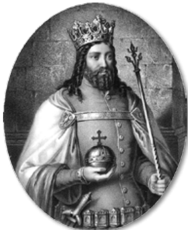
Kazimierz Wielki - grafika Aleksandra Lessera

Najbardziej rzeczowe informacje o powstaniu Skoków zawierał dokument lokacyjny wystawiony w 1367 roku przez Kazimierza Wielkiego. Niestety, oryginał tego aktu uległ przed wiekami zniszczeniu. Jakiś jego odpis znajdował się przed II wojną światową w poznańskim archiwum, lecz później on również zaginął. Mieli do niego dostęp badacze penetrujący archiwa w okresie międzywojennym i dzięki ich pracy zachował się fragment jego treści, opublikowany w latach 20. XX wieku. Do niedawna było to jedyne dostępne źródło dotyczące początków Skoków. Jednakże kilka