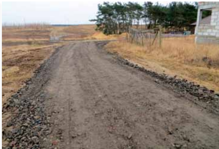
Naprawiona droga - ul. Malinowa w Skokach

Remonty częściowe nawierzchni asfaltowych dróg. W postępowaniu złożono 2 oferty. Najkorzystniejszy oferent wycenił wyremontowanie 1m 2 nawierzchni drogi za kwotę 41,50 zł. Umowę na naprawę dróg o nawierzchni asfaltowej zawarto z Publicznym Towarowym Transportem Drogowym z Budziszewka .