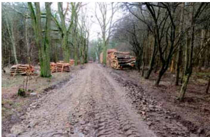
Naprawiona droga Rejowiec – Ignacewo

Usługę transportową samochodem ciężarowym kruszywa i piasku oraz pracę koparko – ładowarką przy bieżącym utrzymaniu dróg gminnych gruntowych. Na ogłoszone postępowanie złożono 10 ofert. Najkorzystniejsza była oferta firmy HEN – BUD ze Skoków z cenami za: transport kruszywa z EKO-ZEC Poznań - 8,20zł/t, transport piasku z KRUSZGEO w Niedźwiedzinach - 3,00 zł/t, usługę samochodem ciężarowym - 58zł/godz. usługę koparko – ładowarką - 63zł/godz.