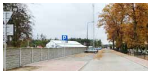
Przebudowa fragm. ul. Rościńskiej w Skokach wzdłuż cmentarza o dł. 245 m - 246.762 zł Inwestycja powiatowa - gmina Skoki dofinansowała 50% kosztów przebudowy. Dodatkowo sfinansowano budowę oświetlenia - 44.895 zł