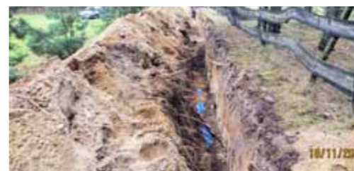
Budowa odcinków sieci wodociągowej w Łosińcu o dł. 603 m, w Potrzezanowie o dł. 257 m i w Sławicy o dł. 525 m - łącznie 117.656,38 zł