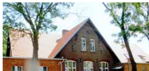
Wymiana pokrycia dachowego wraz z remontem więźby na budynku szkolnym w Jabłkowie - 215.813,17 zł