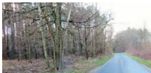
Remont istniejącej nawierzchni bitumicznej na drodze gminnej Potrzezanowo - Budziszewice na odcinku 2048 m - 246.847,73 zł