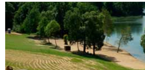
Zagospodarowanie terenu przy Jeziorze Włókna