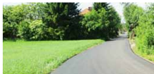
Przebudowa drogi gminnej w Niedzwiedzinach z nawierzchni bitumicznej wraz z podbudową na odcinku 485 m - 229.519,60 zł Budowę dofinansowano z budżetu Województwa Wielkopolskiego