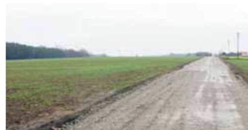
Przebudowa drogi gminnej w Jabłkowie na odcinku 604 m obejmująca I etap tj. ułożenie podbudowy z kruszywa - 80.292,26 zł