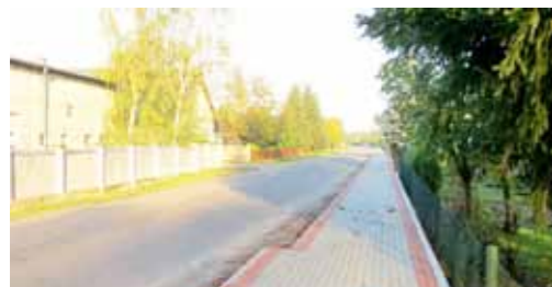
1 etap budowy chodnika wzdłuż drogi gminnej w Rościnnie o długości 515 m - 231.624,63 zł