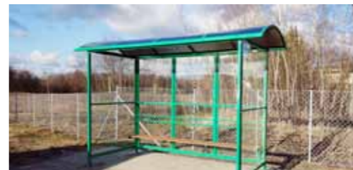
Budowa przystanku w Szczodrochowie