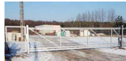
Instalacja bramy wjazdowej sterowanej na pilota na plac przy ul. Rogozińskiej w Skokach