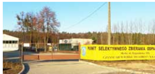
Utwierdzenie placu Punktu Selektywnej Zbiórki Odpadów Komunalnych przy ul. Rogozińskiej w Skokach - 129.138,06 zł