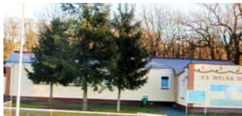
Wykonanie remontu dachu na budynku Klubu Węlna na stadionie miejskim w Skokach - 58.000 zł