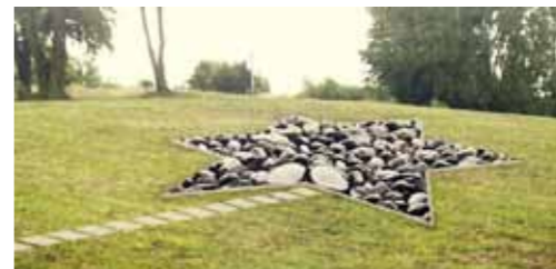
Opracowanie dokumentacji technicznej i projektu zagospodarowania skweru zieleni na cmentarzu żydowskim w Skokach - 23.644,82 zł