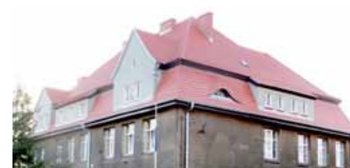
Wymiana pokrycia dachowego i remont elewacji na poziomie poddasza budynku Szkoły Podstawowej w Skokach - 324.184,30 zł