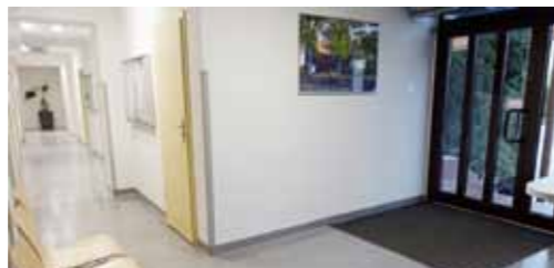
Modernizacja łazienek i korytarzy w budynku Urzędu Miasta i Gminy w Skokach - 193.683,63 zł