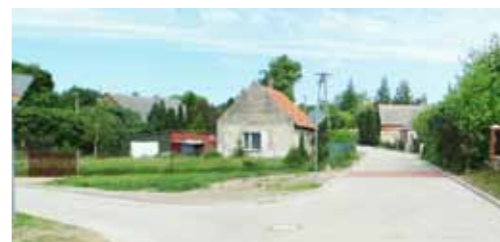
Przebudowa drogi gminnej w Szczodrochowie o dł. 337,5 m z kostki betonowej wraz z kanalizacją deszczową - 249.347,45 zł Budowę dofinansowano z budżetu Województwa Wielkopolskiego