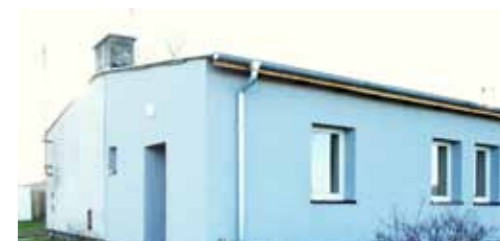
Wykonanie elewacji wraz z pracami porządkowymi wokół świetlicy w Raczkowie - 25.000 zł