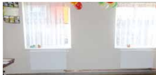
Wybudowano instalację centralnego ogrzewania i wykonano prace remontowe w świetlicy w Brzeźnie - 25.000 zł