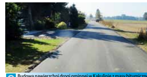
Budowa nawierzchni drogi gminnej w Kakulinie z masy bitumicznej na odcinku 787 m - 245.884,54 zł Budowę dofinansowano z budżetu Województwa Wielkopolskiego