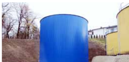
Budowa zbiornika retencyjnego wody o poj. 250m 3 i montaż nowego zestawu hydroforowego w Skokach - 845.910,29 zł