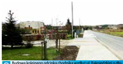
Budowa kolejnego odcinka chodnika wzdłuż ul. Rakojedzkiej o długości 319 m - 78.238 zł Gmina Skoki dofinansowała inwestycję powiatową.