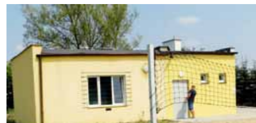
Rozbudowa budynku świetlicy wiejskiej w Jagniewicach m.in. o pomieszczenia kotłowni, węzeł sanitarny i komunikację - 134.500 zł