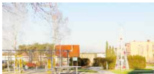
Budowa parku przy ul. Zamkowej w Skokach, w tym m.in. wykonanie alejek, placu do ćwiczeń, oświetlenia oraz wodotrysku - 374.866,90 zł