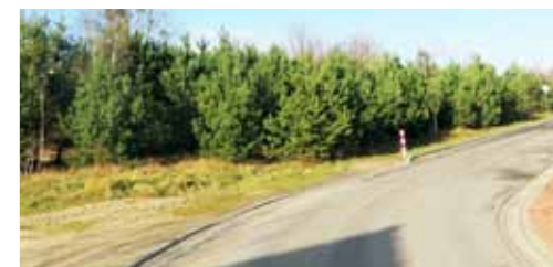
Budowa ul. Podgórnej w Skokach z nawierzchni bitumicznej wraz z podbudową na odcinku 417 m oraz budowa chodnika - 593.063,77 zł