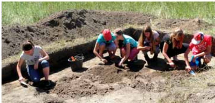
Uczniowie skockiego gimnazjum w trakcie badań wykopaliskowych.

Latem, na polach przysiółka Dzwonowo, archeolodzy z Muzeum Regionalnego w Wągrowcu, przeprowadzili pierwsze badania średniowiecznego miasta Zwanow. Zaginione miasto zostało odkryte w 2014 r. na podstawie analizy zdjęć lotniczych.