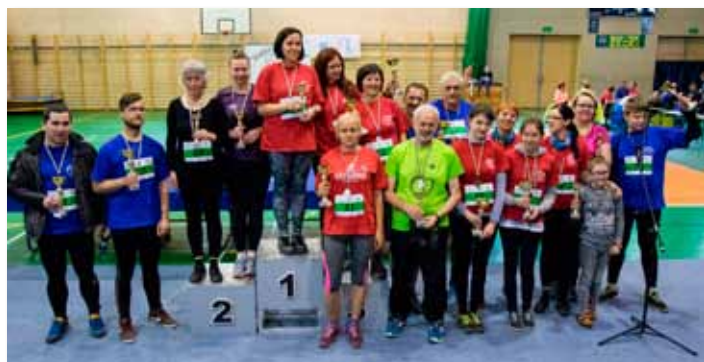
Najlepsi chodźcy Nordic Walking.