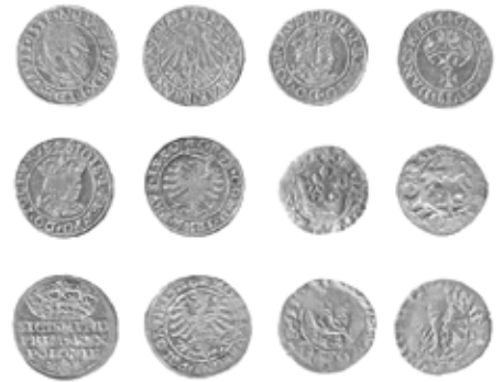
Ryc. 2 Monety ze Skoków po oczyszczeniu.

Wśród monet ze skockiego skarbu znalazło się 85 półgroszy wybitych za panowania Jana Olbrachta, Aleksandra Jagiellończyka oraz Zygmunta I Starego. Są tu jednak również znacznie starsze okazy: 1 ternar (moneta 3-denarowa) i 2 półgrosze Władysława Jagiełły – zwyczajcy spod Grunwaldu. Pół-