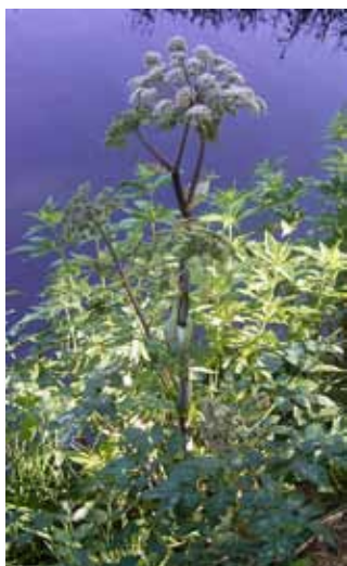
5. Dzięgiel leśny