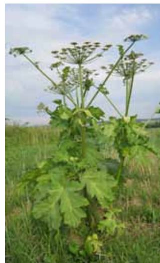
2. Barszcz Sosnowskiego

Kriotechnologia – zastosowanie niskich temperatury cieczy kriotechnicznych mogą spowodować poważne uszkodzenia w tkankach roślinnych, a tym samym przyczynić się do efektywnego niszczenia roślin niepożądanych.