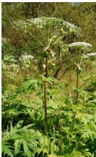
1. Barszcz olbrzymi

Zarówno Barszcz olbrzymi ( Heracleum mantegazzianum Sommier & Levier) (fot. 1) jak i Barszcz Sosnowskiego ( Heracleum sosnowskyi Maden) (fot. 2) to inwazyjne gatunki obce pochodzące z Kaukazu. W latach 60 – tych XX wieku barszcze trafiły w Polsce do uprawy, głównie w państwowych gospodarstwach rolnych.