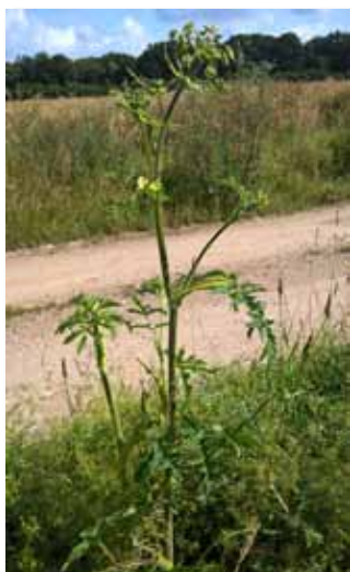
3. Barszcz zwyczajny