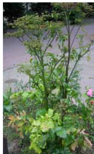
6. Pasternak zwyczajny